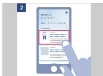
インフォメーション画面内の「ANA スカイ ガッチャ!モール」の記事をタップ