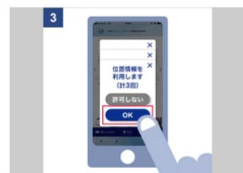
端末の位置情報をON（端末およびアプリ）にし、位置情報を許可する