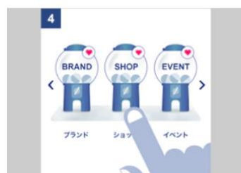
「ANA スカイ ガッチャ!モール」内の気になるお店を選んでガッチャを回す